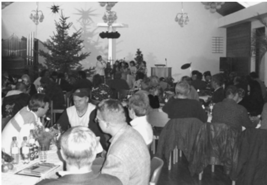
Höhepunkt der Weihnachtsbox: Ein Weihnachtsessen für die Armen des Quartiers