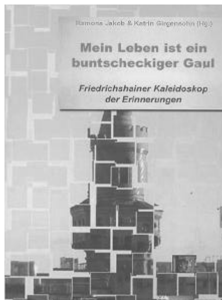
Einband zum Buch

Im Quartiersb ro Krossener Str. 9/10 ist ab sofort das Buch „Mein Leben ist ein buntscheckiger Gaul. Friedrichshainer Kaleidoskop der Erinnerungen“ f r 10 € erh ltlich. Die Geschichten aus dem Buch entstanden in einer Schreibwerkstatt im Rahmen des Quartiersfonds Boxhagener Platz. Friedrichshainer/innen berichten aus ihrem Leben, erz hlen von sch nen und schlechten Zeiten, von Friedrichshain und dem Rest der Welt. Geschichten von Liebe, Essen, Schule, Familie, Geld, Stra en etc. bilden das bunte Kaleidoskop des Lebens. Die ersten 100 (aus dem Quartiersfonds gef rderten) Exemplare waren schnell weg, sodass ein Nachdruck erforderlich war, der jetzt k uflich erworben werden kann.