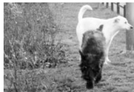
Im Kiez gibt es viele Hunde