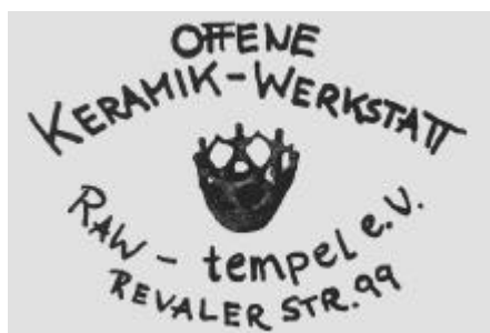
Logo der Keramikwerkstatt vom RAW-Gel nde

Die n chste Sitzung des Vergabebeirats findet am 25. M rz statt. Bis 14 Uhr diesen Tages k nnen wieder Antr ge eingereicht werden.