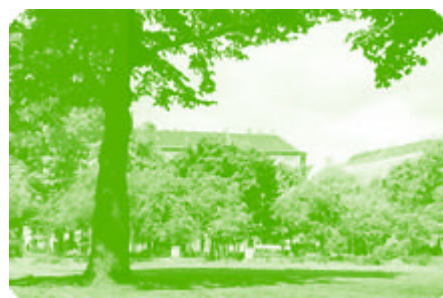
Ansicht vom Boxhagener Platz

Die nächste Sitzung des Vergabebeirats findet am 29. April statt. Bis 14 Uhr diesen Tages können wieder Anträge eingereicht werden.