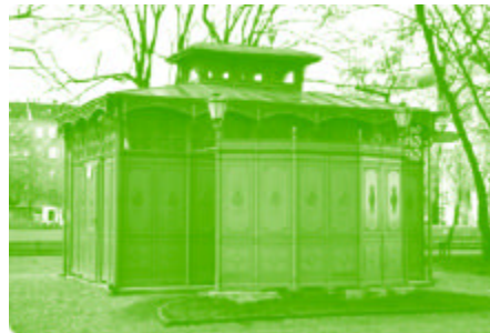
Toilettenhäuschen am Boxhagener Platz

Infos & Kontakt: BEST, c/o Technologie-Netzwerk Berlin e.V., Wiesenstr. 29, 13357 Berlin, fon 469 88 227, fax 461 24 18, best@technet-berlin.de