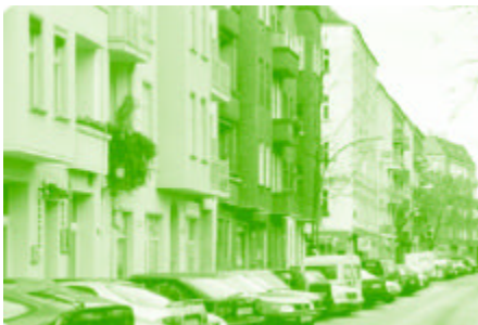
Interessante An- und Aussichten bietet der Kiez

Das Projekt Quartiersfonds Boxhagener Platz 2001/02 wurde zum 31. Dezember 2002 abgeschlossen. Eine vollständige Dokumentation aller eingereichten Projekte und der Abschlussstand ist unter der Adresse www.boxhagenerplatz.de/qtfonds bzw. im Quartiersbüro einzusehen.