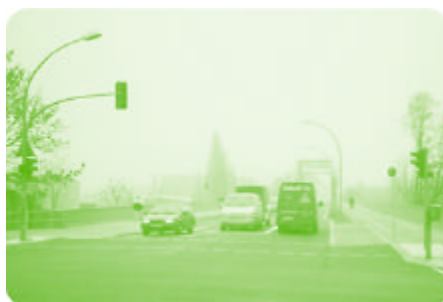
Verkehrsfluss über die Modersohnbrücke