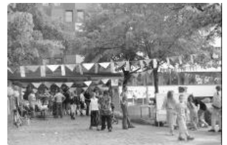
Festlich geschmückter Hof der Modersohnschule

Am Samstag, 14. Juni, 14 - 16 Uhr werden die "Hundefreunde Friedrichshain e.V." wieder eine Aufräum- und Pflanzaktion auf dem Grundstück Revaler/Ecke Modersohnstraße starten. Für die Bepflanzung der Brache werden noch Stauden und Sträucher gesucht. Infos unter 297 71 515