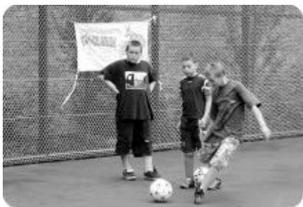
Fußballspieler am Bolzplatz

Offizieller Start der Geburtstagsaktionen ist der 13. Juni mit der Eröffnung des Ausstellungspfades an 10 Orten im Quartier. Am Sonntag, 15. Juni, 11 Uhr findet die erste Kiezführung statt. Detaillierte Informationen auf der nächsten Seite und im Internet unter www.boxhagenerplatz.de/100jahre Info-Hotline: 74 73 25 40