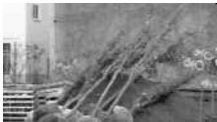
Herbstzeit ist Pflanzzeit