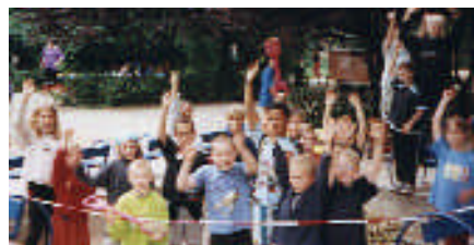
Freude über Geld aus dem Aktionsfonds

Fünf Anträge positiv beschieden Insgesamt 1.150 Euro bewilligte die Vergabejury aus Bewohnern des Kiezes auf ihrer Sitzung am 26. August. Zuwendungen erhalten: Bankleer Berlin in Kooperation mit workstation/ideenwerkstatt, Zille Grundschule, KFE Känguruh, Ev. Kita Sonnenblume, Kita Jungstraße. Vier der zehn Anträge wurden abgelehnt, einer wurde zurückgestellt. Für die kommenden vier Sitzungen verbleiben noch 6.898 Euro. Die nächste Sitzung ist am 30. September ; bis 14:00 Uhr diesen Tages können formlose, schriftliche Anträge eingereicht werden. Ab 19:00 Uhr können Antragsteller ihre Vorhaben selbst vorstellen. Quartiersbüro Krossener Str. 9/10 fon 294 92 501.