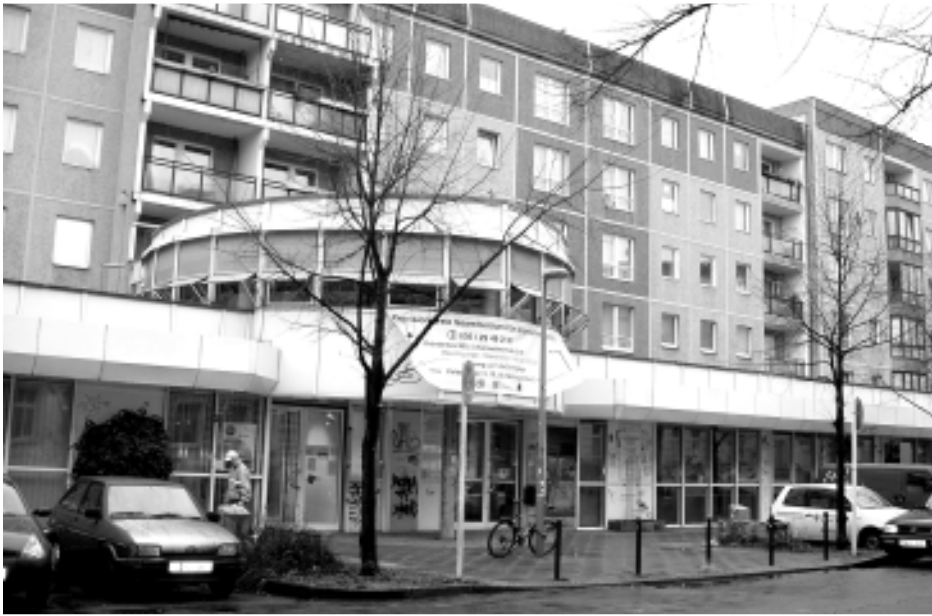
Auch das zweite Gründerzentrum in der Scharnweberstraße 23 ist schon zur Hälfte vermietet