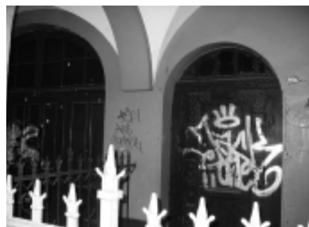
Tür zu! Wie die Grundschule in der Scharnweber Straße künftig nutzen?

Mit Hilfe der Fachhochschule für Technik und Wirtschaft wurde für den bundesweiten Wettbewerb eine eigene Internetseite entwickelt: www.schulfrei.org . Am 24. und 25. Januar sind erste Rundgänge durch die frühere Grundschule vorgesehen. Nähere Informationen gibt es unter ☎ 28 09 16 05.