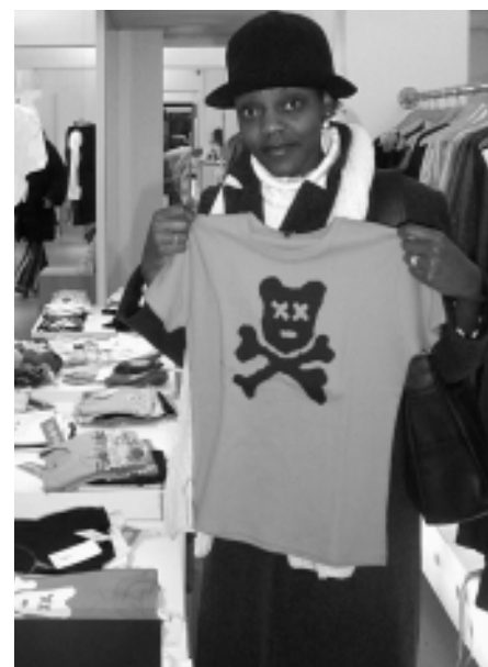
Partystimmung und Schnäppchen: Der Nikolaus Sale war ein Erfolg