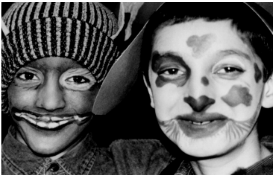
„typisch – respect your neighbourhood“ bringt Kulturen am Boxhagener Platz zusammen