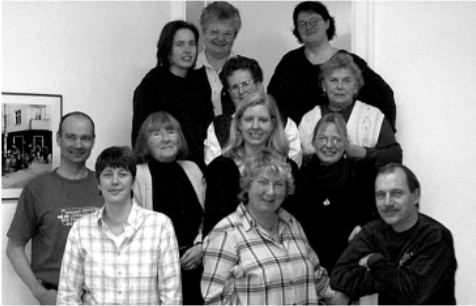
Die Teilnehmer der 2. Friedrichshainer Schreibwerkstatt haben ganz persönliche Geschichten zu Papier gebracht