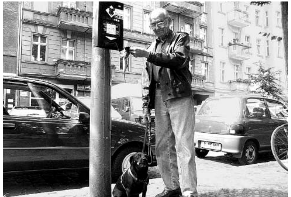
Das lässt hoffen: Hundehalter im Kiez machen sich stark für die Nutzung der Tütenspender

Seit rund drei Jahren steht das Schulgebäude in der Böcklinstraße leer, seit etwa zwei Jahren die ehemalige Schule in der Scharnweberstraße. Der Liegenschafts-