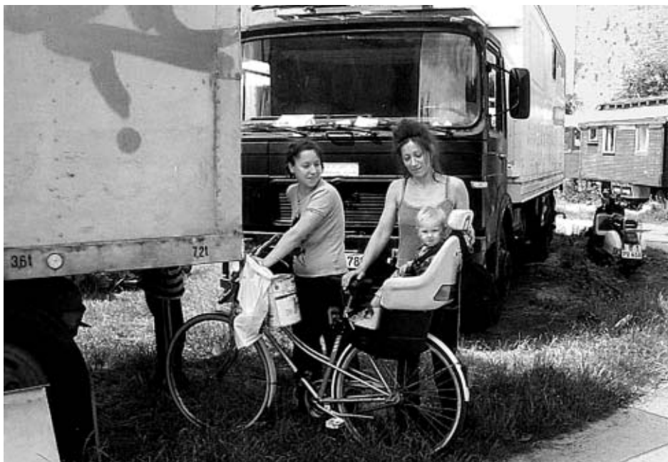
Wohin mit den jetzigen Nutzern, wenn der Freizeitpark kommt? Wagenburg-Bewohner an der Revaler/Ecke Modersohnstraße