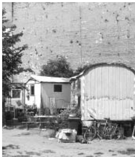
Revaler-/Ecke Modersohnstraße: Was wird gebraucht im Kiez?